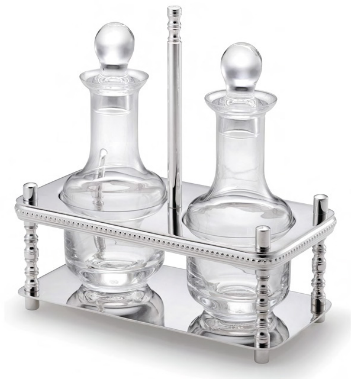
GALHETEIRO COM 3 PEÇAS 2080 - Med. 20cm (h) / 9cm (l) / 19cm (c)