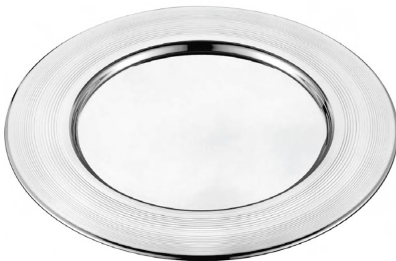
SOUSPLAT SPIN 1356 - Med. 32cm (Ø)