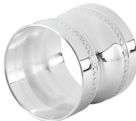
ARGOLA DE GUARDANAPO PÉROLA

1815 - Med. M: espessura 8mm / 4,9cm (Ø)