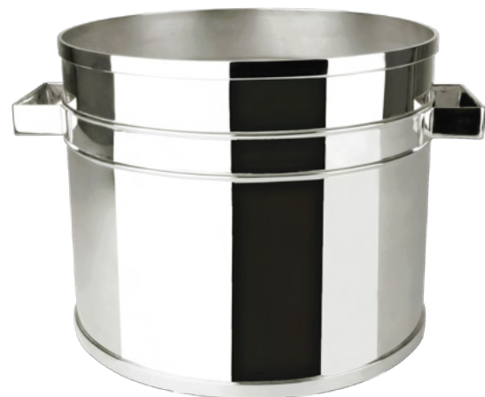
BALDE PARA 6 GARRAFAS

3470 - Med.: cap 2,8L / 20cm (h) / 21cm (Ø)