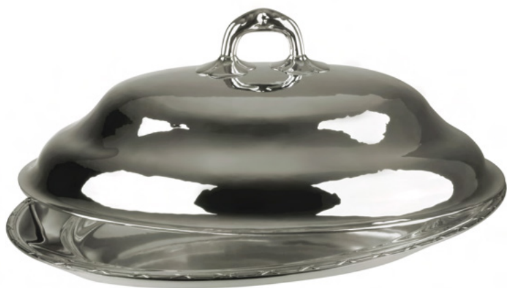
PRATO PARA ASSADO COM TAMPA