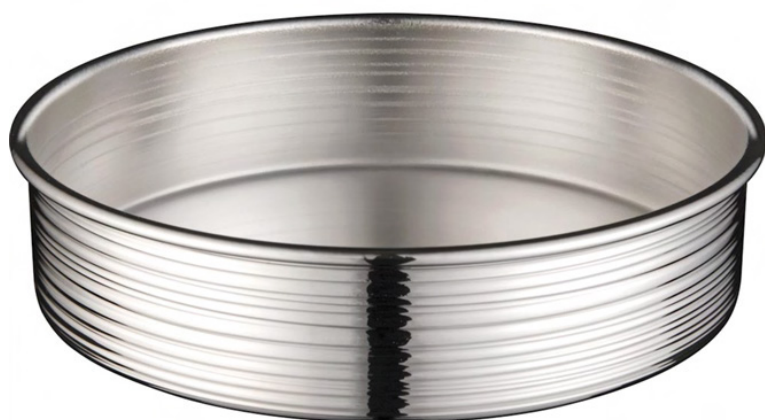
PORTA GARRAFA SPIN 1342 - Med. 5cm (h) / 13cm (Ø)