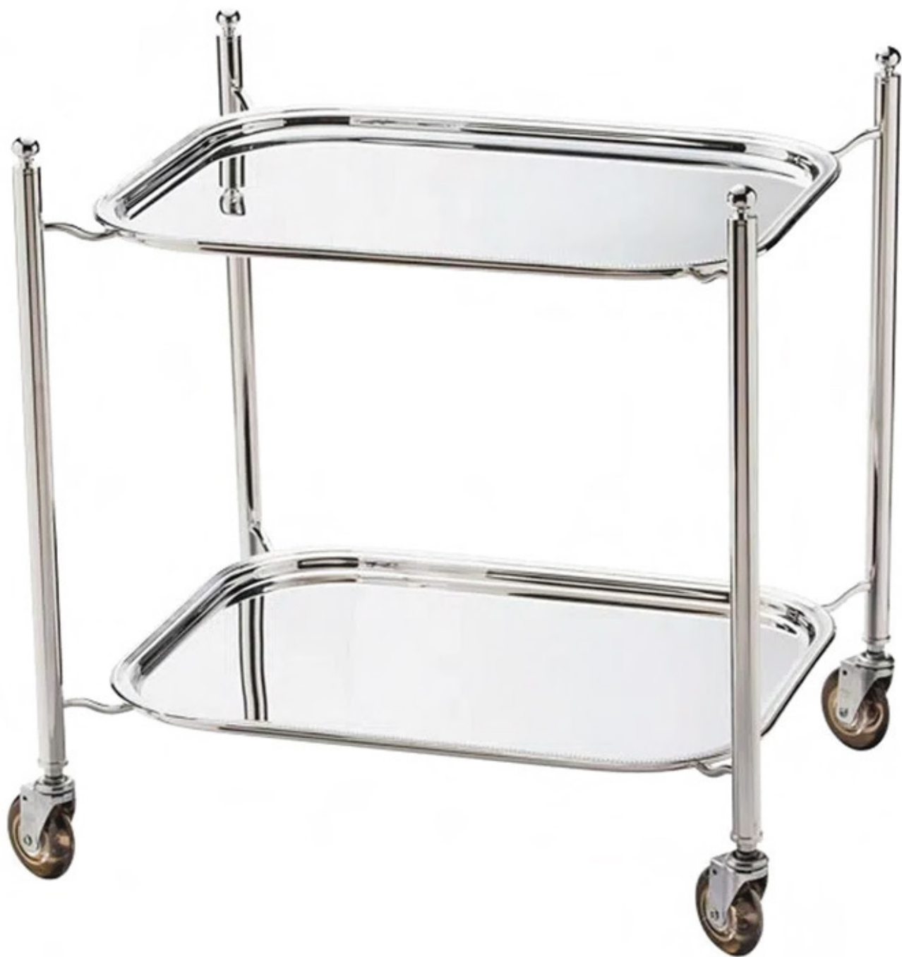
CARRINHO DE CHÁ PÉROLA COM 2 BANDEJAS

1819 - Med.: 58cm (h) / 50cm (c) / 52cm (l)