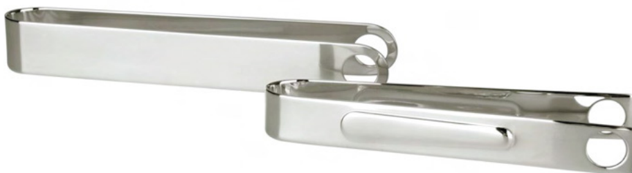
PEGADOR DE GELO