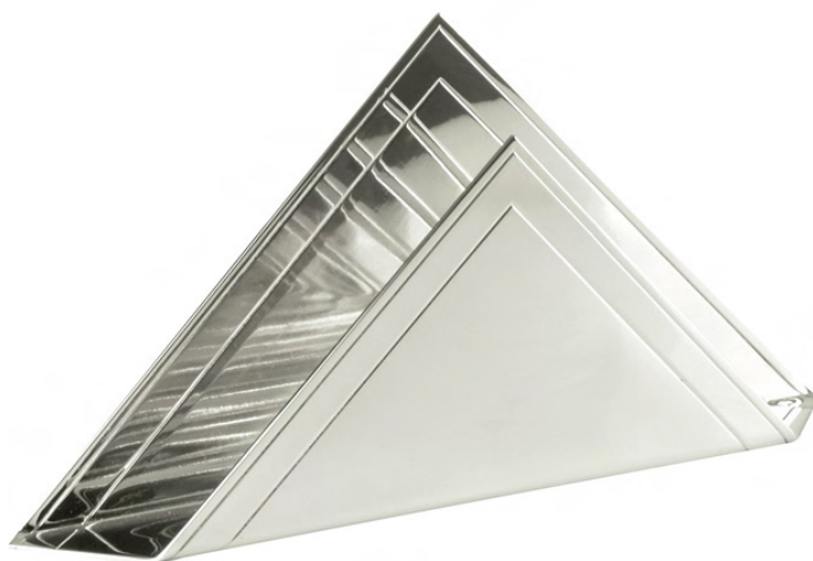
PORTA GUARDANAPO TRIANGULAR COM FRISO 166N - Med. 10cm (h) / 20cm (l)