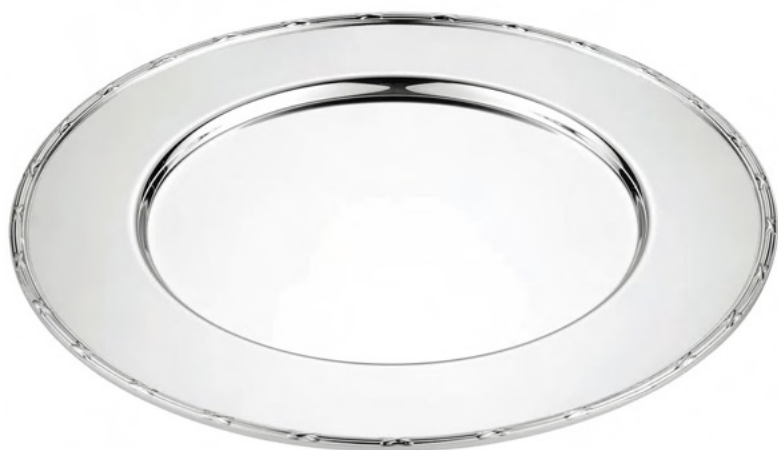
SOUSPLAT COM CORDÃO 751 - Med. Cordão Croisé: 32cm (Ø) 018B - Med. Cordão Liso: 32cm (Ø) 1059 - Med. Cordão Pérola: 32cm (Ø)