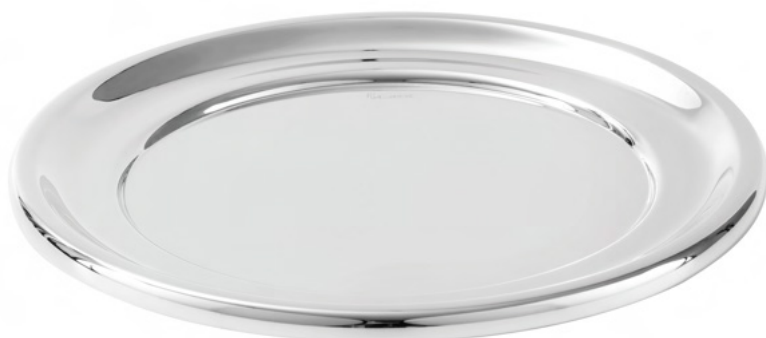
SALVA DESCANSO DE TALHER