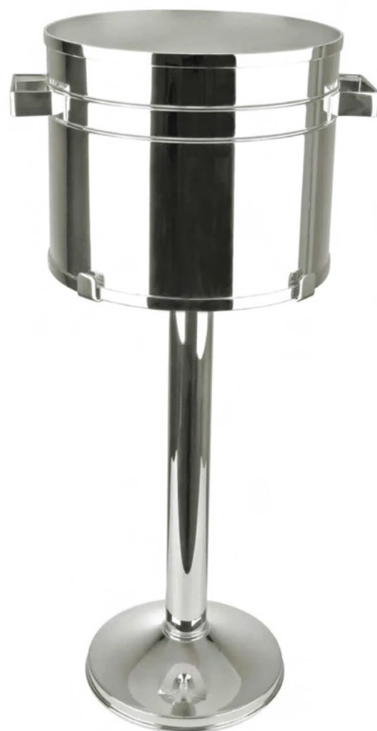
BALDE PARA 6 GARRAFAS COM COLUNA

8952 - Med.: cap 1,4L / 20,5cm (h) / 20cm (Ø)