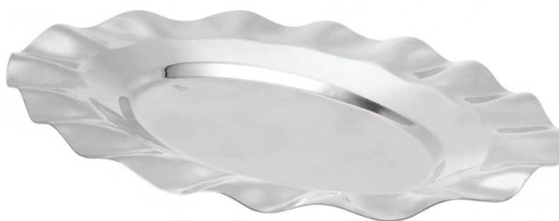
PRATINHO SALVA OVAL BABADO