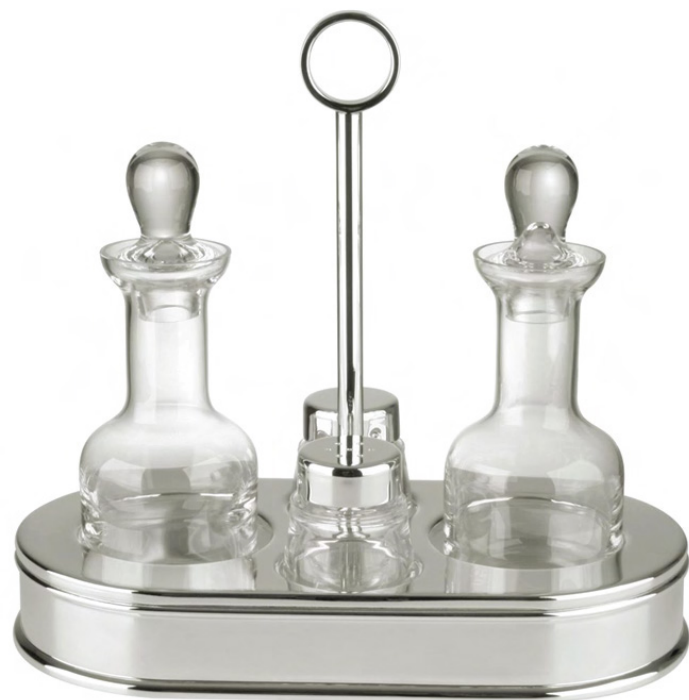
GALHETEIRO COM 5 PEÇAS 300 - Med. 23cm (h) / 12,5cm (l) / 21,5cm (c)