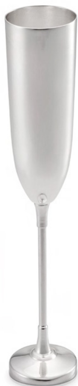
TAÇA PARA CHAMPAGNE

2072 - Med.: cap 150ml / 20cm (h) / 5,5cm (Ø)