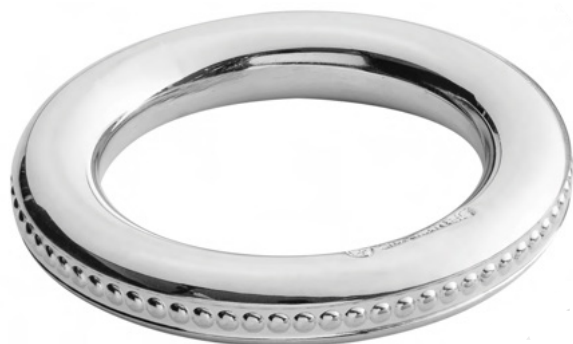
ARGOLA DE GUARDANAPO BLOOM

1815 - Med. M: espessura 8mm / 4,9cm (Ø)