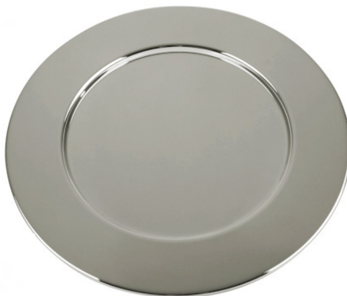
SOUSPLAT LISO 8773 - Med. 32cm (Ø)