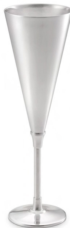
TAÇA PARA CHAMPAGNE

2072 - Med.: cap 150ml / 20cm (h) / 5,5cm (Ø)