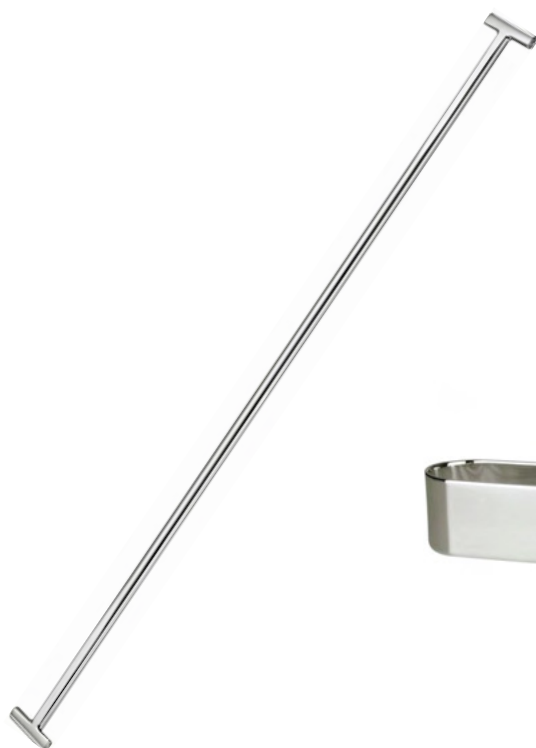
MISTURADOR DE DRINKS

2371 - Med. P: espessura 1mm / 3,6cm (c) / 2,8cm (Ø)