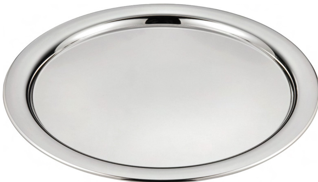
BANDEJA DE GARÇOM 665 - Med. P: 37cm (Ø) 666 - Med. G: 42cm (Ø)