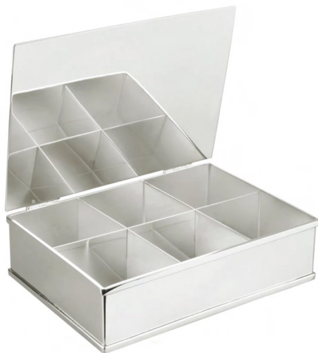
CAIXA DE CHÁ COM 6 DIVISÕES

896 - Med. 7,5cm (h) / 20,5cm (l) / 14,5cm (c)