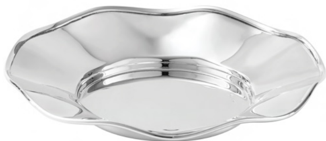
PRATINHO SALVA REDONDO BABADO

3828 - Med. Travessa Redonda G: 60cm (Ø)