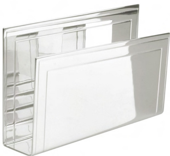
PORTA GUARDANAPO RETANGULAR COM FRISO 166AN - Med. 9cm (h) / 15cm (l)