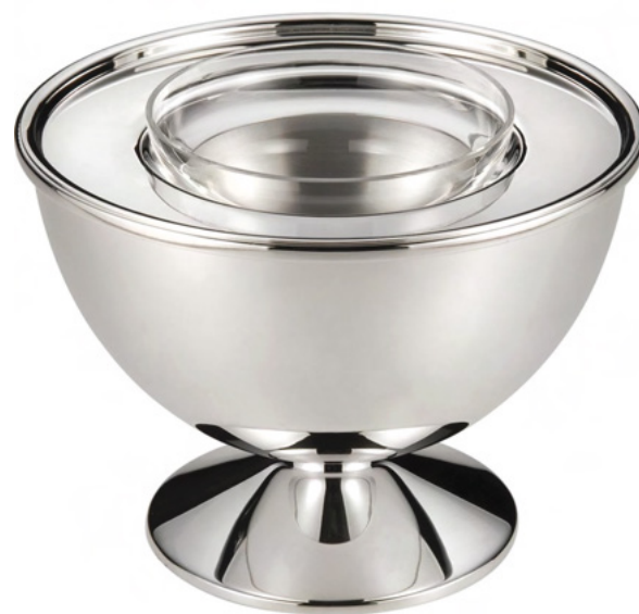
PORTA CAVIAR VIENA