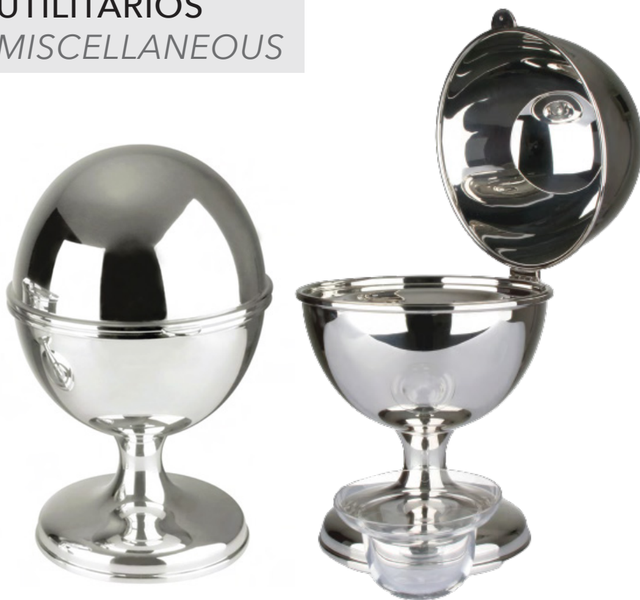
PORTA CAVIAR OVO