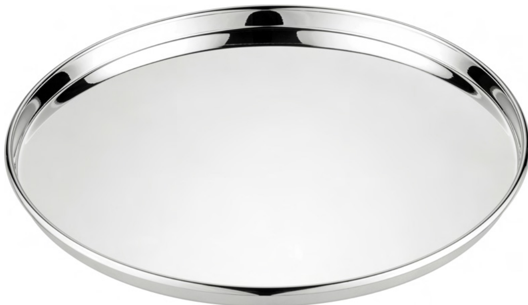
BANDEJA DE GARÇOM REDONDA COM BORDA 788 - Med. 40cm (Ø)