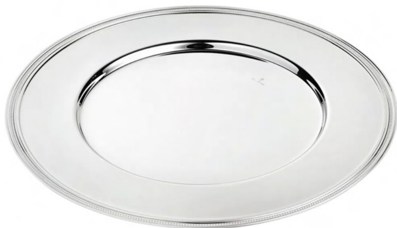
SOUSPLAT BLOOM 1818 - Med. 32cm (Ø)