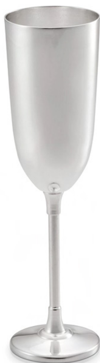
TAÇA PARA VINHO

2073 - Med.: cap 170ml / 25cm (h) / 6,5cm (Ø)