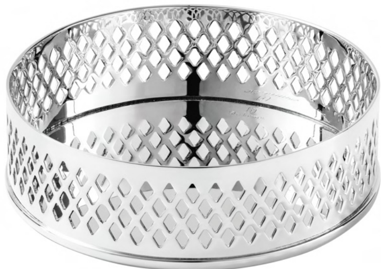
PORTA GARRAFA GALERIA LOSANGO 8442 - Med. 13cm (Ø)