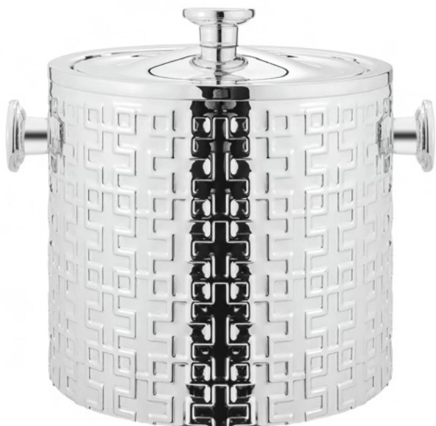
BALDE TÉRMICO LEGACY

3470 - Med.: cap 2,8L / 20cm (h) / 21cm (Ø)