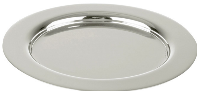
PORTA COPO REDONDO 931 - Med. 11cm (Ø)