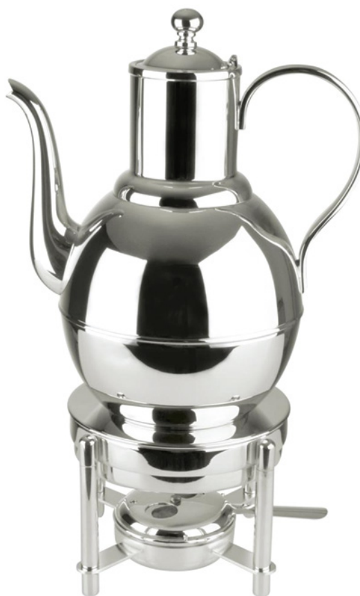
SAMOVAR COM BANHO MARIA